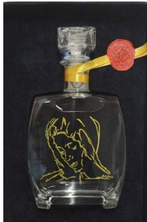
Bottiglia realizzata per l'evento dall'Arch. Rainaldi