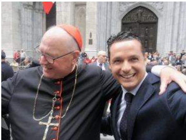
S.E. il Cardinale Dolan con il Presidente Valente

La candidatura del Premio sarà ufficializzata in primavera in Italia al Senato della Repubblica, per poi partecipare alla sessione ottobre 2019 per la premiazione che si terrà come ogni anno a Washington DC.